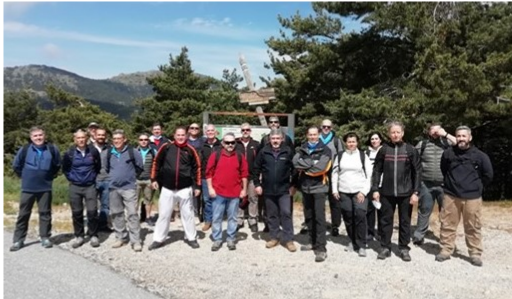
Marcha en la zona de Guadarrama

Asimismo, personal de la UVE participó en la marcha organizada por el EMACON en diciembre.