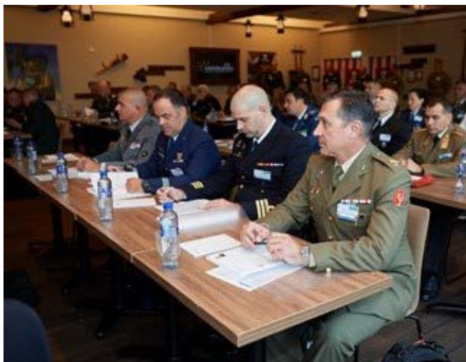
Evento DV11 en Dinamarca