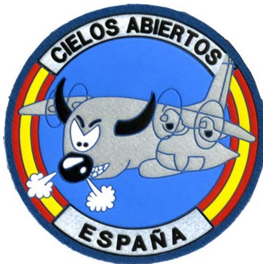
Parche del Grupo de Cielos Abiertos de la Unidad de Verificación Española

Sin actividad debido a la situación provocada por la pandemia de COVID-19