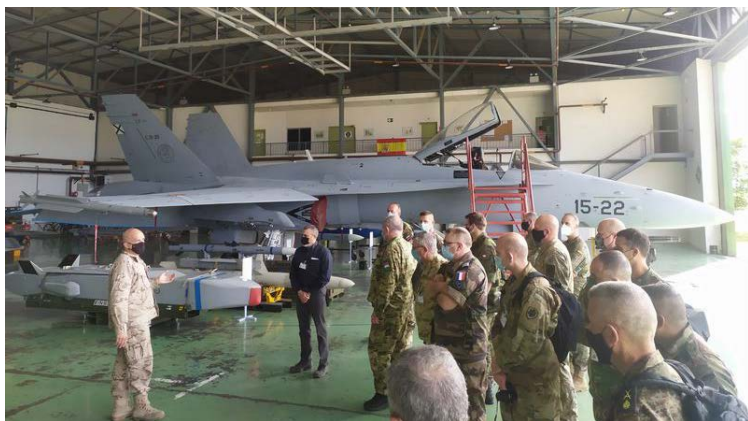
Visita a la BA de Zaragoza