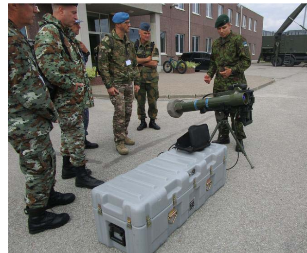
Evento DV11 en Repúblicas Bálticas