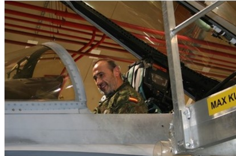
Inspección DV11 de Bélgica en Finlandia