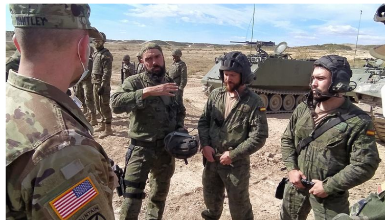
Visita a instalación militar. RAC "Pavía"4