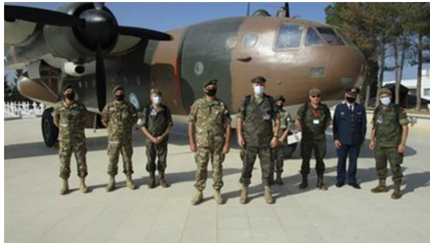
Inspección DV11 de España en Chipre