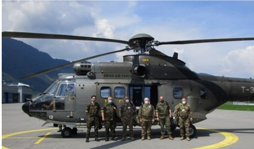
Evaluación DV11 de Eslovenia en Suiza

Sin actividad debido a la situación provocada por la COVID-19.