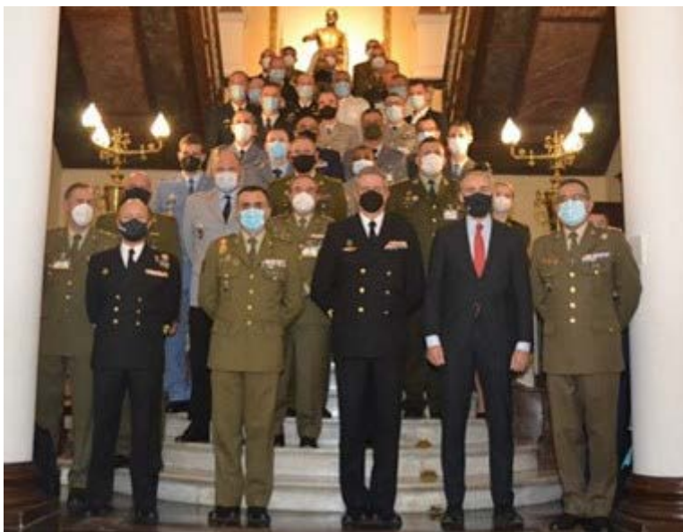
Recepción de delegados en la Capitanía General de Zaragoza