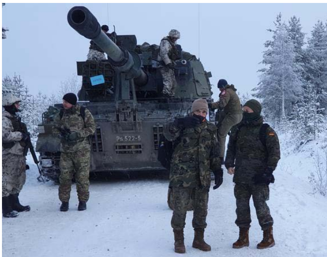
Evento DV11 en Finlandia

Además, la UVE participó en el mes de octubre en el Evento de DV11 en Dinamarca, y en el mes de noviembre en el Evento de DV11 en Finlandia.