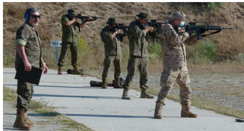
Ejercicio de tiro en el Goloso

Con la finalidad de mantener a los cuadros de mando instruidos en su utilización, se llevó a cabo un ejercicio de tiro con pistola y fusil HK en mayo, según lo establecido en el PIUVE, en el campo de tiro del Goloso.