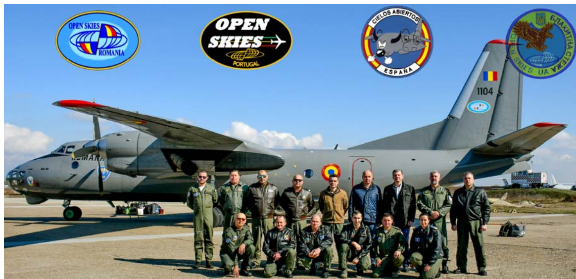
Vuelo de observación liderado por Portugal sobre Ucrania

Sin actividad debido a la situación provocada por la COVID-19.