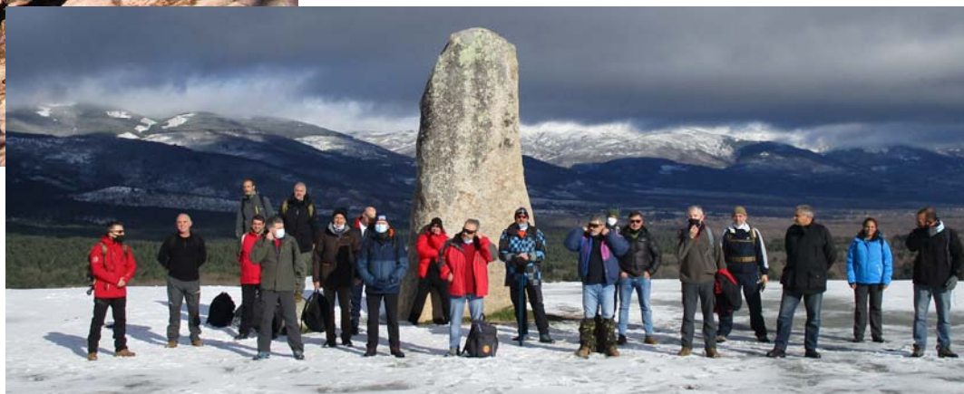
Marcha en la zona de Rascafría