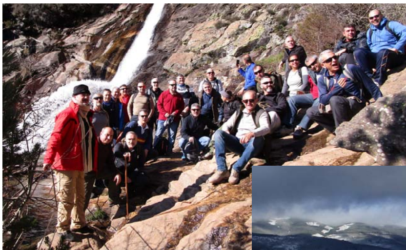
Marcha en la zona de San Mamés

Asimismo, personal de la UVE participó en la marcha organizada por el EMACON en diciembre.