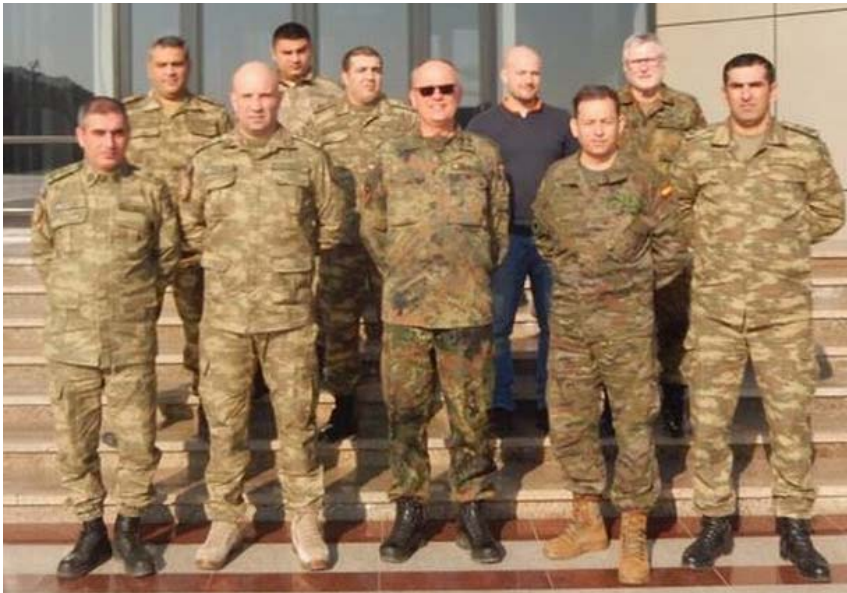
Evaluación DV11 de Alemania en Azerbaiyán

El Jefe de la UVE y parte del Equipo de Escolta designado para la actividad visitaron en agosto la Base Aérea de Zaragoza y el Regimiento de Caballería 'España' 11, donde estaba previsto llevarse a cabo en noviembre un triple evento (visita a base aérea, visita a instalación militar, presentación de nuevos tipos). Finalmente tuvo que ser pospuesto a octubre de 2021 debido a la situación provocada por la COVID-19.