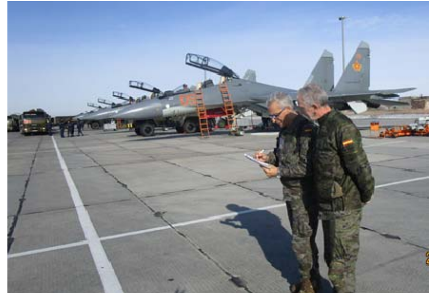
Evaluación DV11 de España en Kazajistán